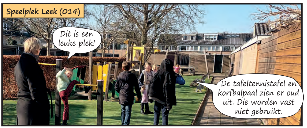
Speelplek Leek (014)

De eerste steeg dichtbij school gaan we in