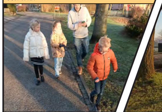
Er zijn weinig stoepen dus we moeten goed opletten. Maar lopen op de stoepranden is ook leuk!