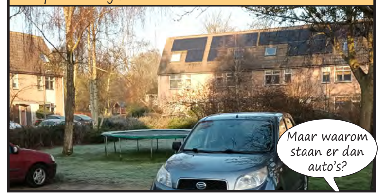
Op het pleintje van de Goudert hebben bewoners zelf een trampoline neergezet.