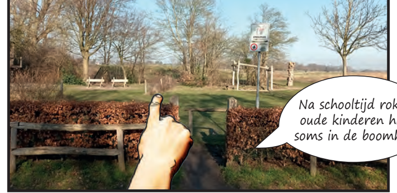
Bij Zakedijkje (013) spelen de kinderen met school en ook na school komen ze er graag.

Na schooltijd roken oude kinderen hier soms in de boomhut.