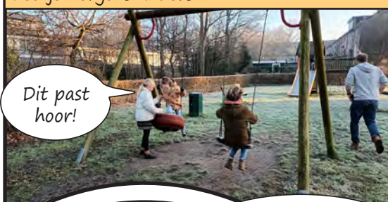
Bij de Goudert (004) is het ook leuk spelen in het gras. De schommel is leuk want die heb je nergens anders.

Soms hebben de bewoners wel last van ons.