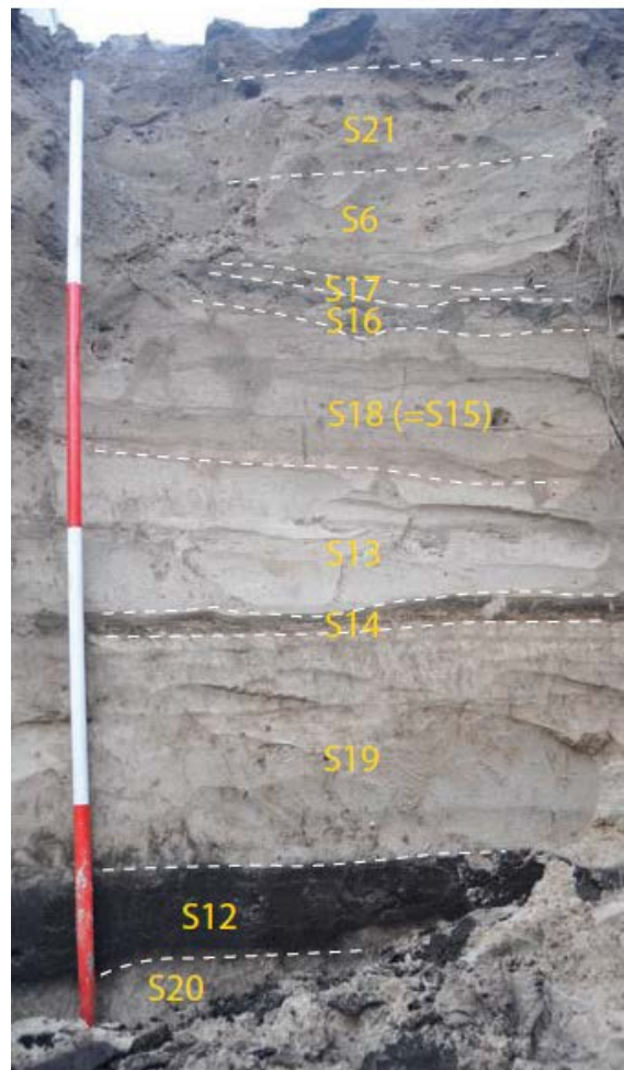
Fig. 4 Dit is de bodemopbouw tot ruim 2 onder de straatstenen rond de Ruinekerk, bij de huidige fietsenwinkel.

Bergen ligt op een complex van haakwallen. Dat zijn zandruggen die de zee heeft neergelegd ten tijde van het zeegat bij Bergen.