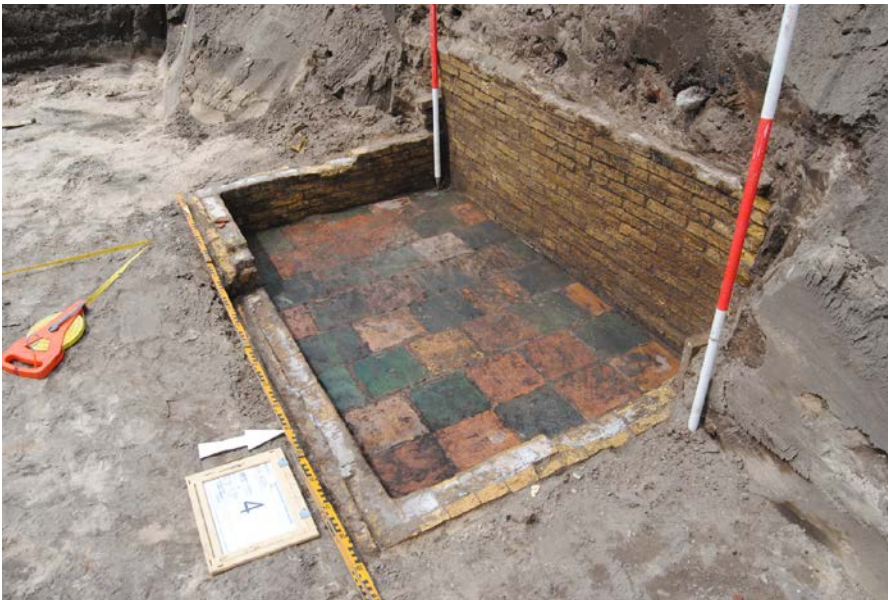
Fig. 2 Aan de Herenweg te Egmond Binnen vonden archeologen deze kleurrijke resten van een waterput uit de 17 e of 18 e eeuw.

We maken onderscheid tussen te verwachten en reeds bekende vindplaatsen. Archeologische vindplaatsen zijn vaak onzichtbaar, maar door studie en veldonderzoek weten we waar de kans groot is dat er archeologische resten in de grond liggen. Dat onderzoek richt zich op allerlei bronnen, zoals oude kaarten, bodemkaarten en op de resultaten van archeologisch onderzoek in de omgeving of op vergelijkbare plaatsen. Het landelijke Archeologisch Informatiesysteem (ARCHIS) is daarbij een belangrijk hulpmiddel. Het bevat onder meer een waarnemingenlijst. Waarnemingen zijn vondsten en sporen (meestal grondverkleuringen, maar ook structuren zoals op fig. 2) die gemeld zijn door individuen, amateurarcheologen en archeologen.