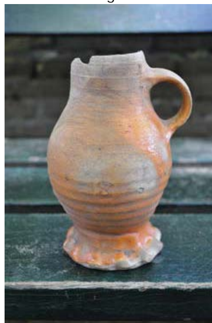
Fig. 5 Steengoed kruik uit de 15 e eeuw gevonden tijdens archeologisch onderzoek bij de Ruinekerk te Bergen.

Zoals reeds beschreven vereist de Monumentenwet dat bij projecten van 100 m 2 en groter rekening moet worden gehouden met archeologie. In onze gemeente liggen vindplaatsen, zoals molenrestanten, die kleiner zijn dan 100 m 2 . Zulke vindplaatsen zouden dus ongezien vernietigd kunnen worden als de beoogde ontwikkeling kleiner is dan 100 m 2 . Daarom kiest de gemeente een ondergrens van 50 m 2 voor dergelijke vindplaatsen. Anderzijds zijn er plekken in de gemeente waar de kans op archeologische resten in de bodem klein is, dan is een minder streng regime (2500 m 2 , 500m 2 of vrijstelling) op zijn plaats.