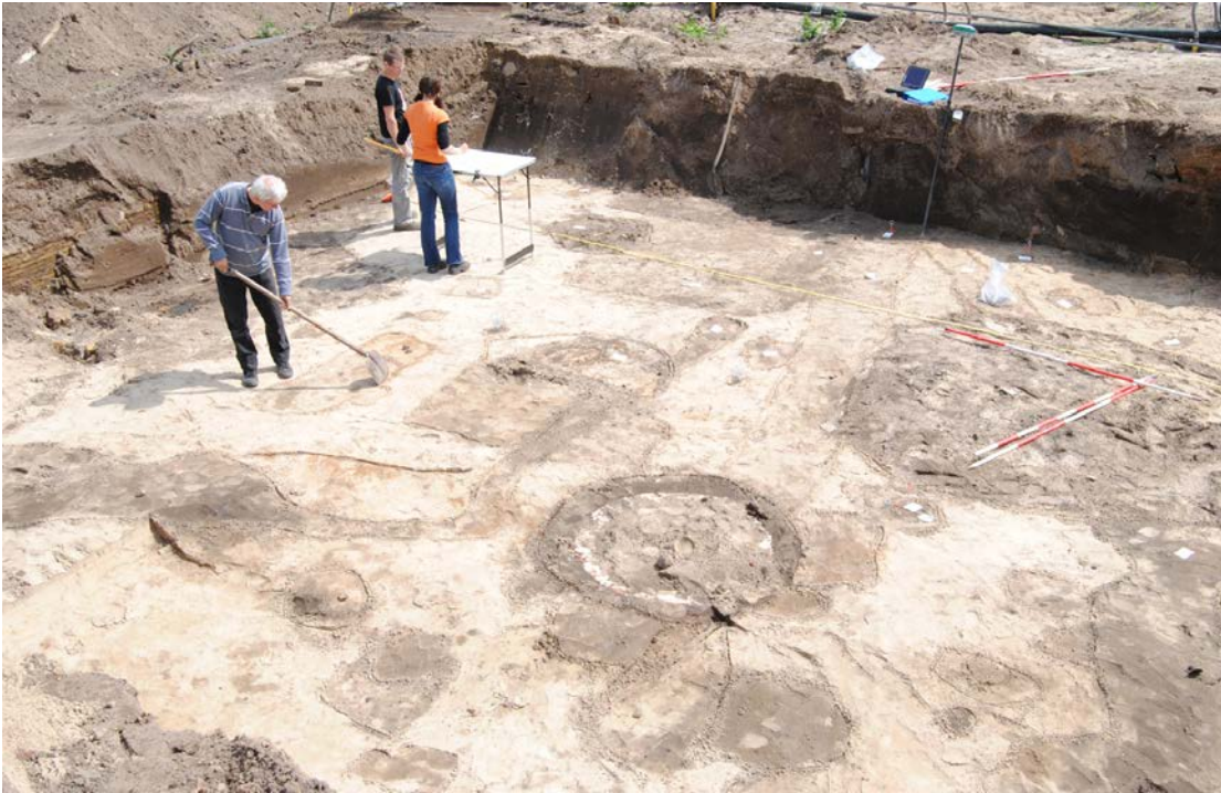
Fig. 3 Opgraving aan de Herenweg te Egmond, 2010.

De Rijksdienst voor het Cultureel Erfgoed beheert sinds 1994 een landsdekkende Archeologische Monumentenkaart (AMK). De AMK geeft een overzicht van alle bekende behoudswaardige archeologische terreinen. De gemeente heeft geen beschermde archeologische monumenten, maar wel vijf terreinen van zeer hoge waarde volgens de AMK. De AMK-terreinen zijn overgenomen op de gemeentelijke Beleidskaart Archeologie.