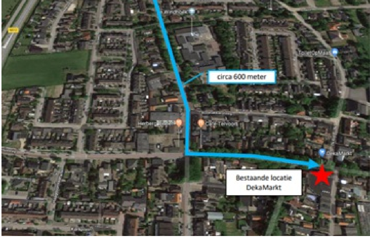
Figuur 1: locatie bestaande en beoogde nieuwe locatie DekaMarkt

Omdat er vanwege de locatie een samenhang tussen deze drie projecten zit, wordt in deze raadsinformatiebrief ingegaan op de drie projecten. We lichten toe hoe de samenwerking georganiseerd is, zodat er een integrale gebiedsvisie gemaakt kan worden voor de Visweg. Daarbij kunnen we voordelen bereiken door gezamenlijk onderzoeken te doen en werkzaamheden uit te voeren.