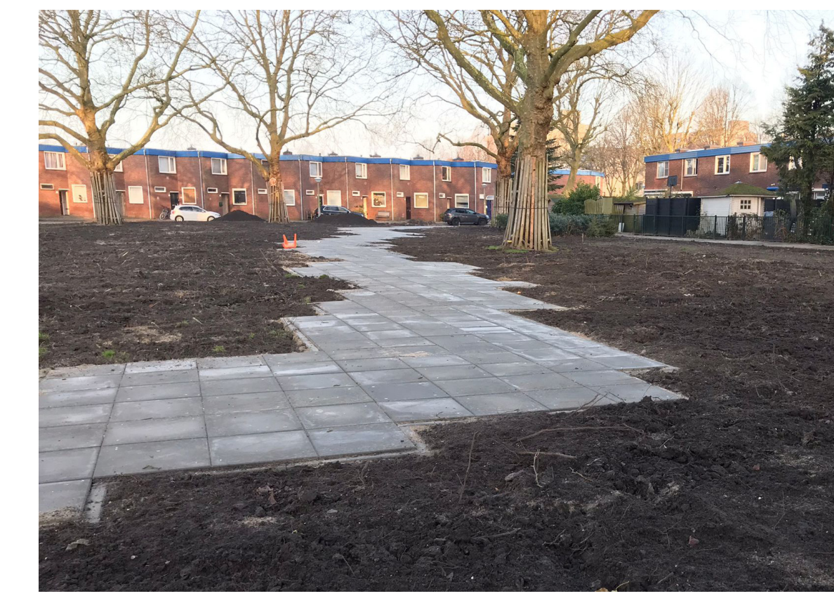
Pad van betontegels, onderkant boven gelegd voor robuust uiterlijk