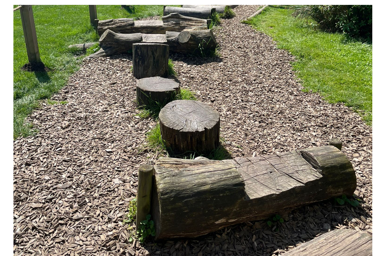
Speelbosje met struipaden