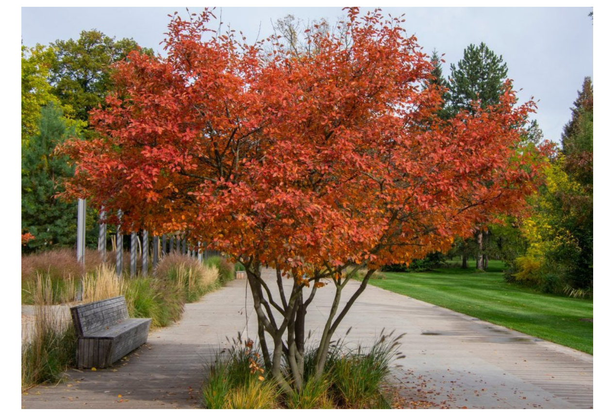
Solitaire heesters met opvallende herfstkleuren