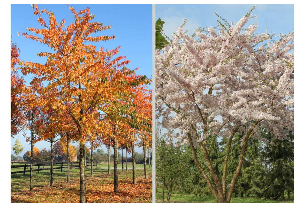
Bomen met bloei in voorjaar en opvallende herfstkleuren