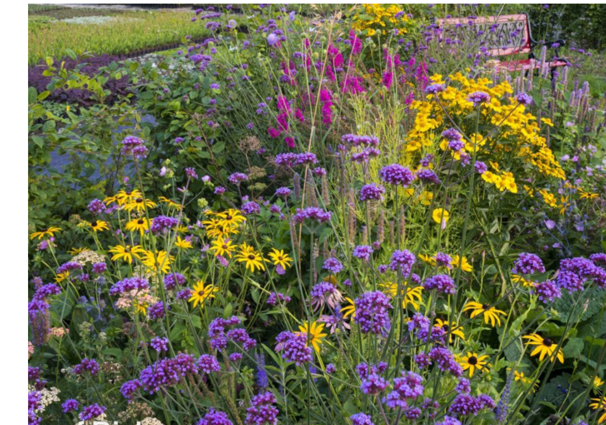
Plantvakken met inheemse vaste planten met kleurrijke bloei