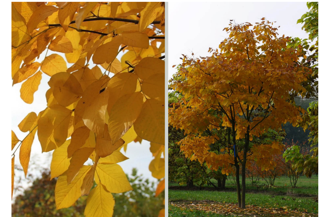
Bomen met opvallende herfstkleuren