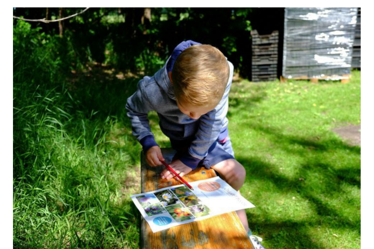
Educatie door middel van beplanting