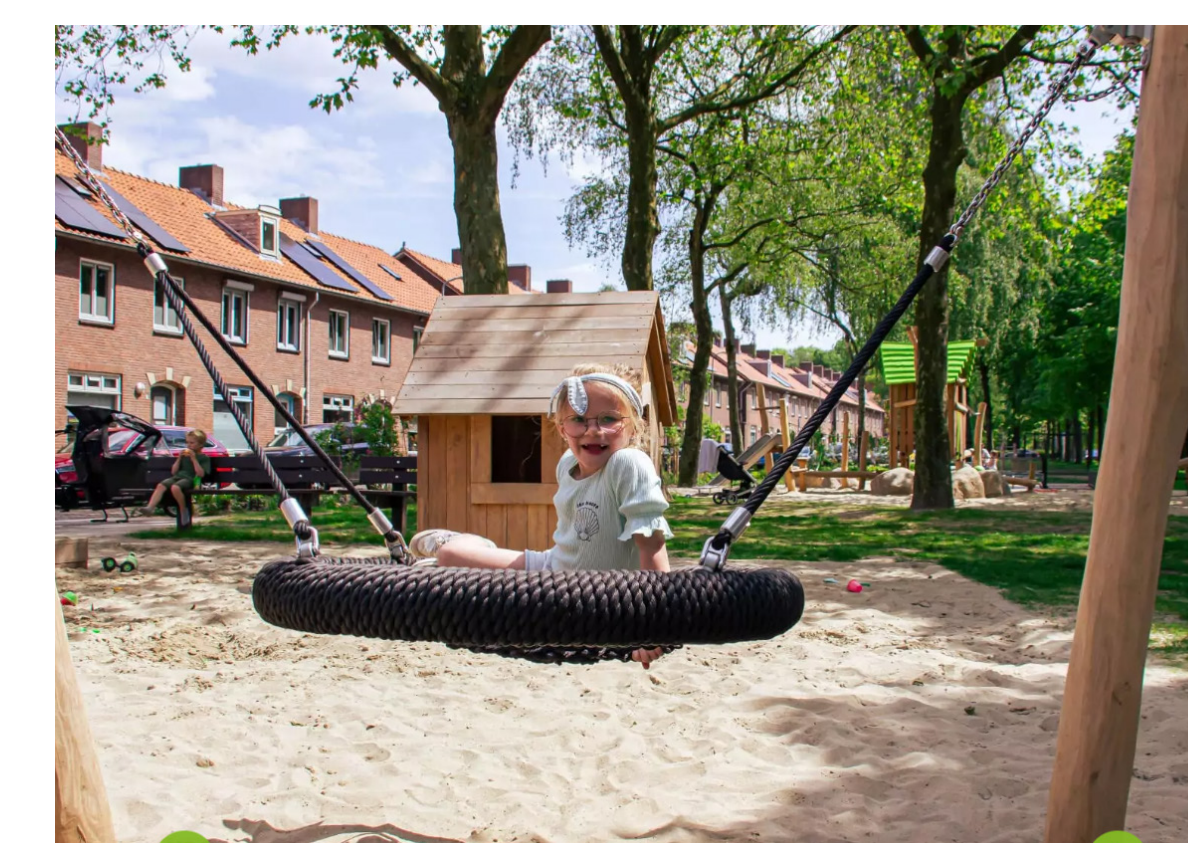
Speelaanleiding van natuurlijke materialen